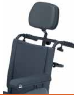
Cabecero standard Montado en respaldo de nylon