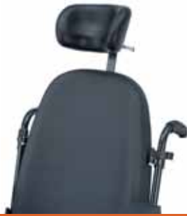
Cabecero anatómico Montado en respaldo ana- tómico