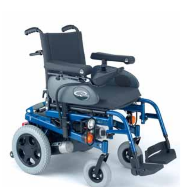
Luces e indicadores Para una conducción más segura