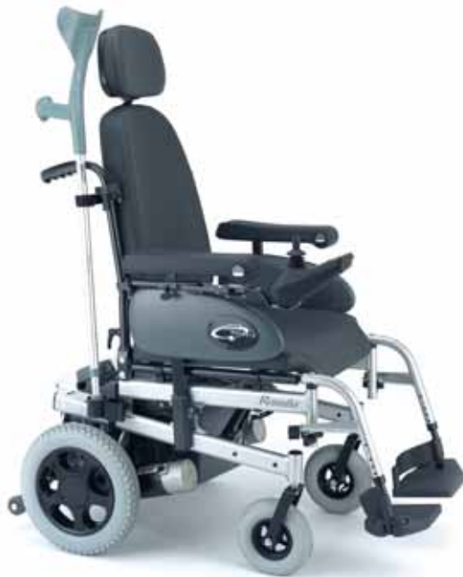
Soporte de bastones