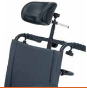
Cabecero anatómico Montado en respaldo de nylon