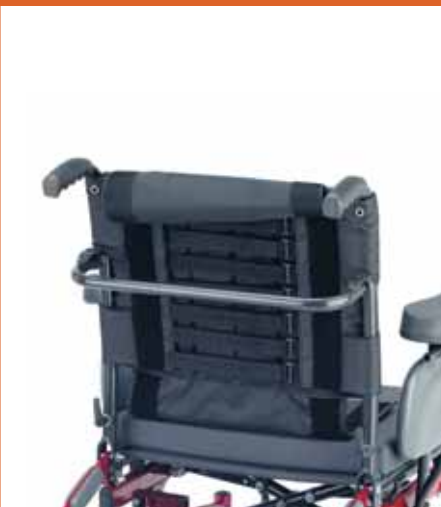
Respaldo ajustable en tensión