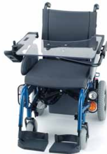
Mesa abatible y ajustable En profundidad