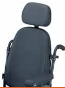
Cabecero standard Montado en respaldo anatómico