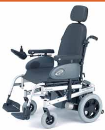
Asiento y respaldo anatómicos